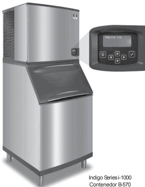
Indigo Series i-1000 Contenedor B-570

Diseñado para operarios que saben que la producción de hielo es crítica para su negocio, la nueva serie Indigo™ incluye un controlador con diagnóstico preventivo el cual continuamente monitorea la producción de hielo por sí misma. Desarrollos en innovación en saneamiento y programación hacen de esta máquina la más fácil y menos costosa para operar.